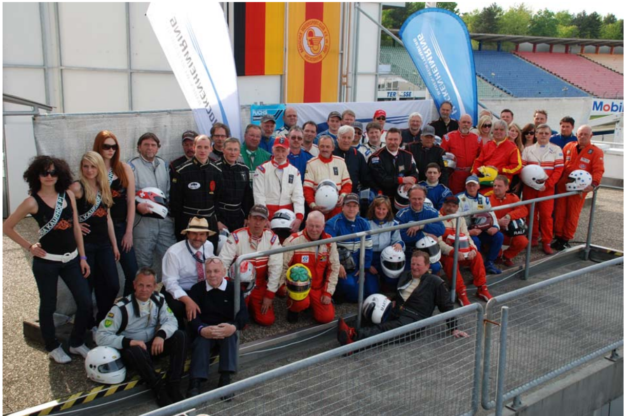
Fahrerinnen und Fahrer der Historischen Formel Vau und Super Vau in Hockenheim 2009